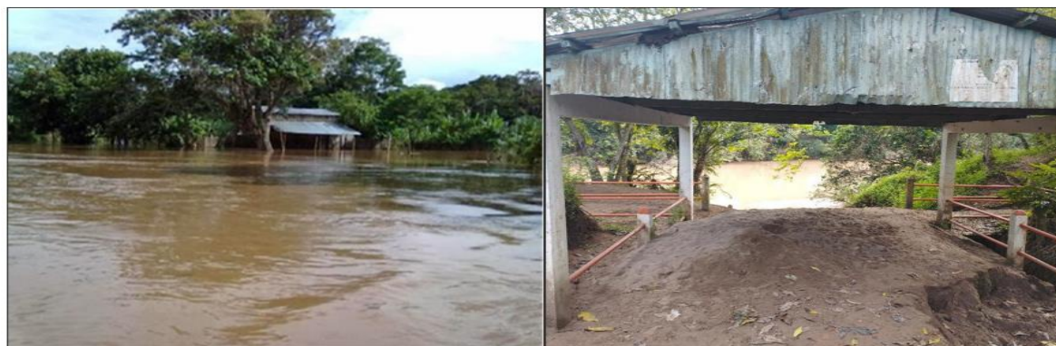
FIGURA N°02: TRAMO CRÍTICO EN EL RÍO SAPOSOA, MIRADOR Y PUERTO CANTORCILLO INUNDADO EN TÍEPOS DE MAXIMAS AVENIDAS, Y POR LA VELOCIDAD DEL AGUA VIENE EROSIONANDO EL TALÚD DE LA RIBERA.