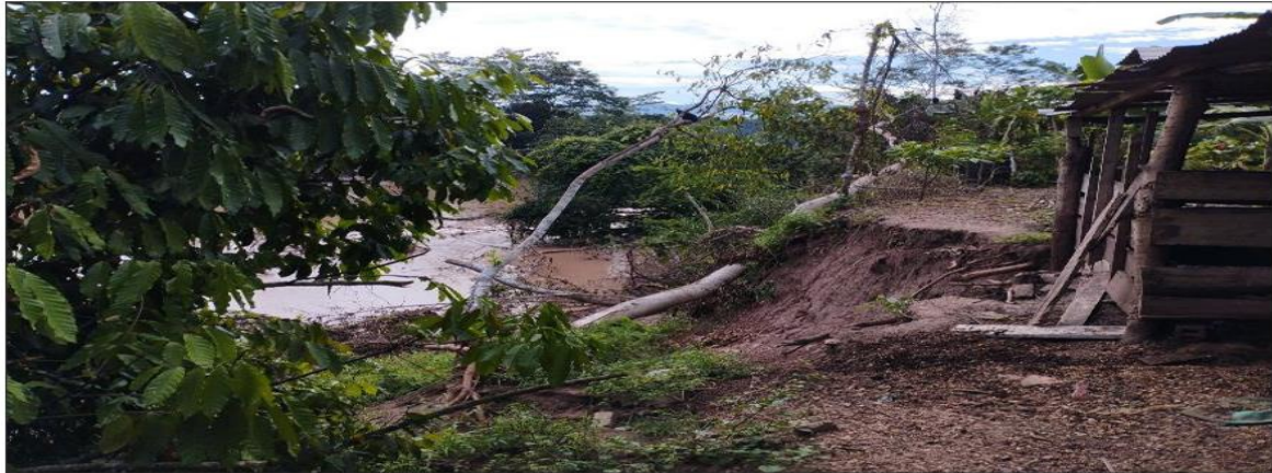
FIGURA N°03: TRAMO CRÍTICO EN EL RÍO SAPOSOA, DONDE SE PRODUJO SOCAVAMIENTO DE LA RIBERA GENERANDO LA CAIDA DE ARBOLES, AFECTANDO A LAS VIVIENDAS ALEDAÑAS Y ÁREAS ADE CULTIVO.