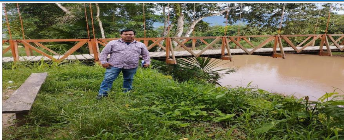
FIGURA N°01: TRAMO CRÍTICO EN EL RÍO SAPOSOA, SECTOR CANTORCILLO, DISTRITO DE SAPOSOA, PROVINCIA HUALLAGA - SAN MARTIN